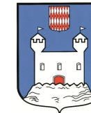
TOURETTE DU- CHÂTEAU