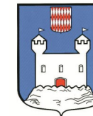
TOURETTE DU- CHÂTEAU